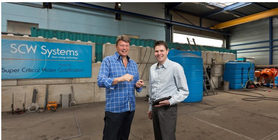
Investerings in innovaties voor groen gas productie