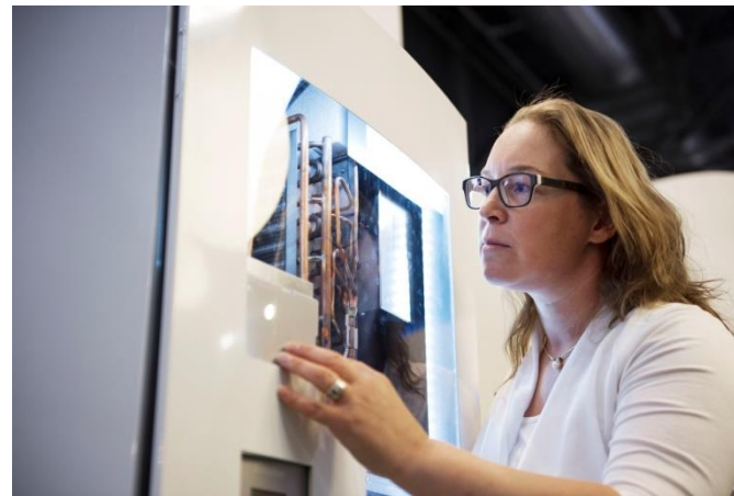
Introductie van hybride warmtepompen in Groningen