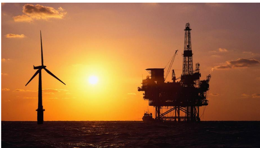
Samenwerking op de Noordzee